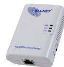
MODEM CPL SANS INJECTEUR POE ALL168205