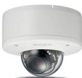
DÔME HD EXTÉRIEUR À OBJECTIF VARIFOCAL SNC-EM602RC