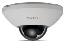
CAMÉRA FULL HD MINI-DÔME INTÉRIEUR SNC-XM631