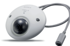
CAMÉRA FULL HD MINI-DÔME EXTÉRIEUR SNC-XM632