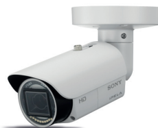
CAMÉRA TUBE HD EXTÉRIEURE IR 25M EB602R