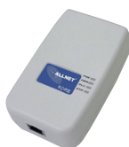
MODEM CPL AVEC INJECTEUR POE ALL168203