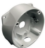
FIXATION MURALE ET POTEAUX POUR CAMÉRAS FIXES UNI-BBB1